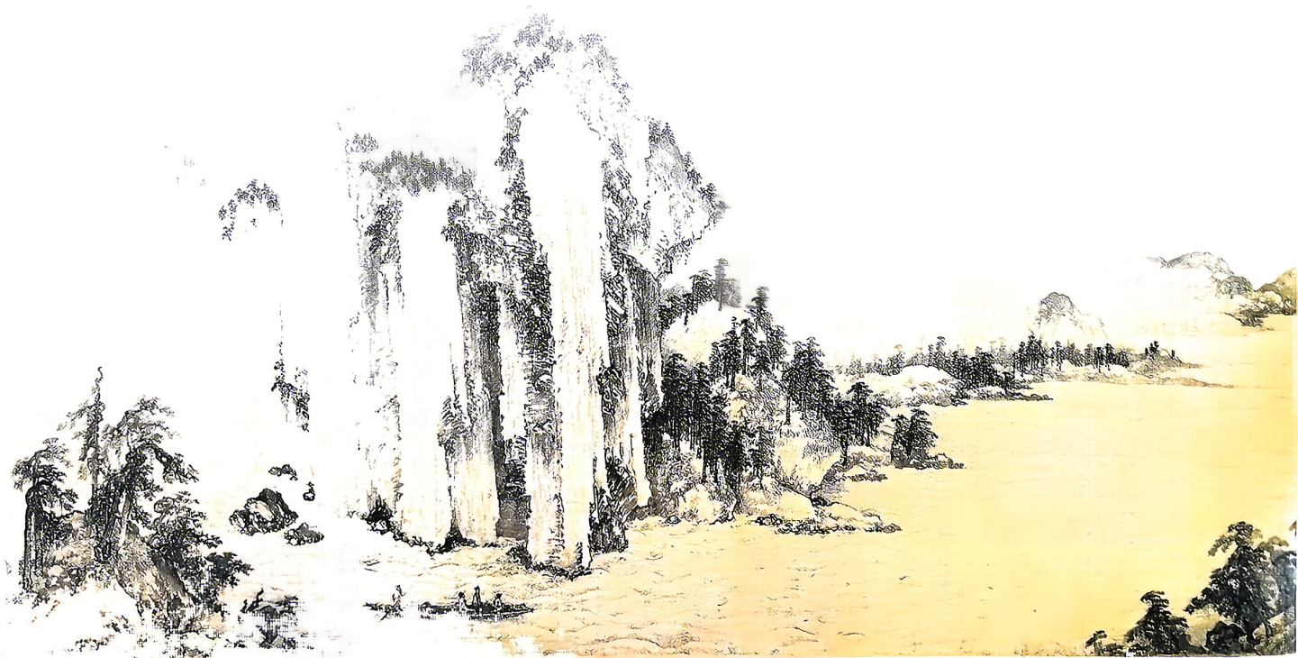
赤壁图（局部）[金]武元直 作

3. “人生如梦，一尊还酹江月”一句，有人认为流露了及时行乐的消极情绪，有人认为体现了随缘自适的旷达胸怀。结合词作内容和作者的人生经历，与同学交流自己的理解。