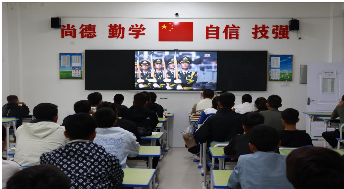
图 4-3 学生观看阅兵仪式