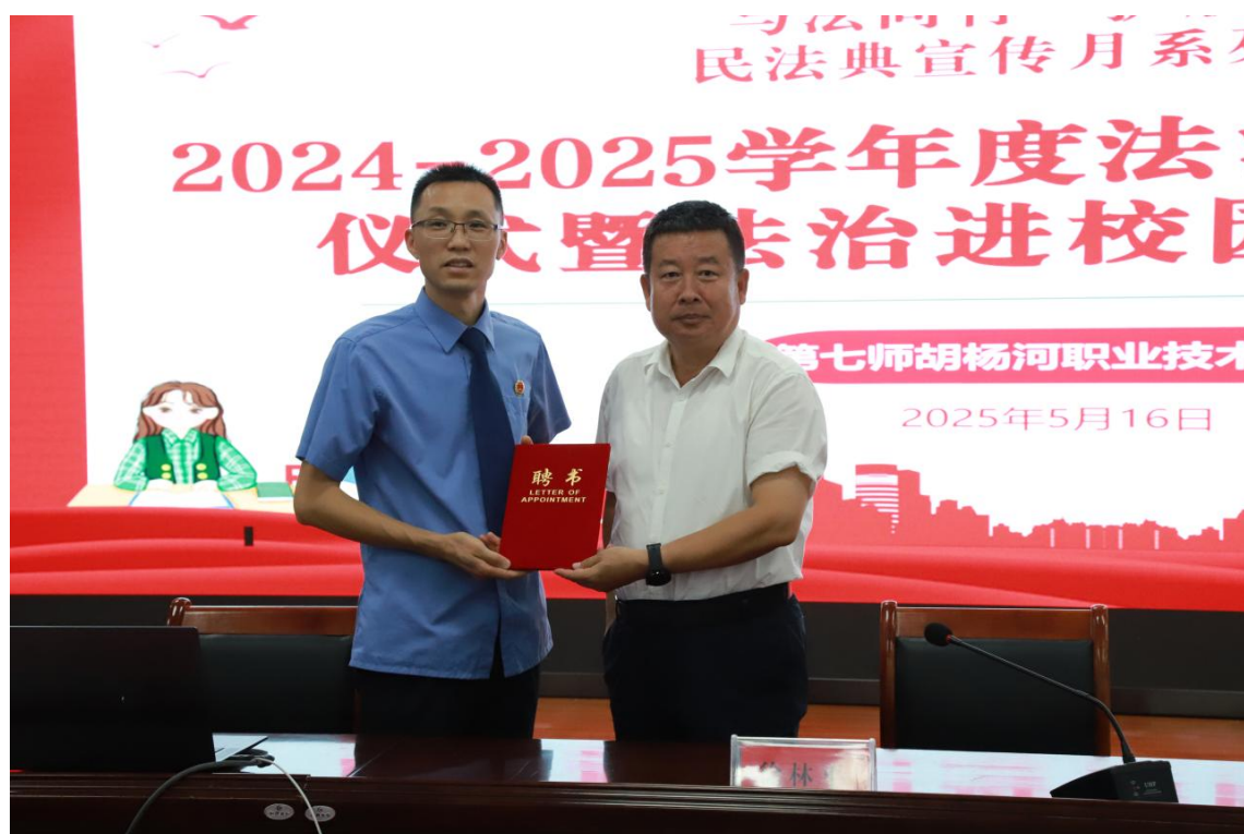
图 2-4 法治安全教育

构建“法治课堂+实践活动+氛围营造”法治教育体系。法治副校长围绕校园霸凌、网络安全和未成年人保护等主题开展专题讲座 9 次；组织学生参与国家宪法日“宪法晨读”和法治知识竞赛等活动；在校园设置法治文化长廊，张贴法治标语和宣传画，营造浓厚法治氛围。通过多样化教育形式，学生法治意识明显增强，校园违纪违法事件发生率为零。