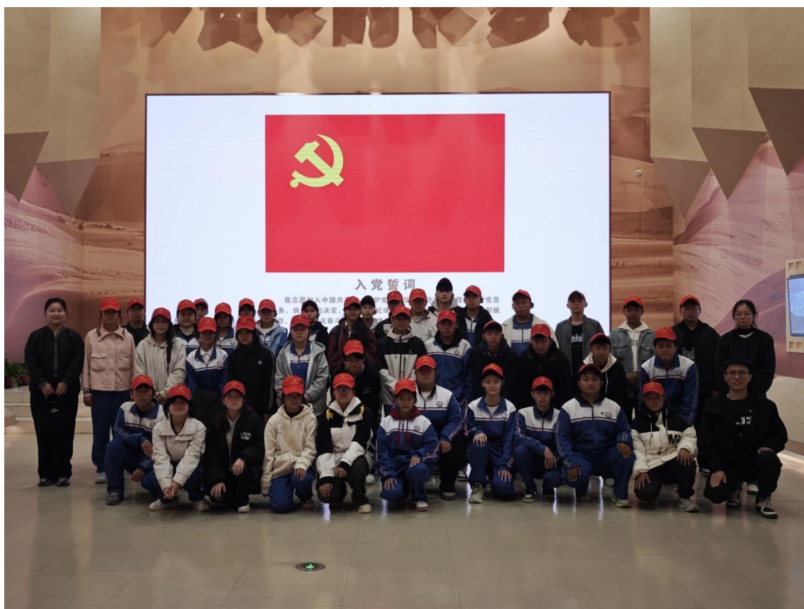
图 2-1 赴石河子军垦博物馆参观