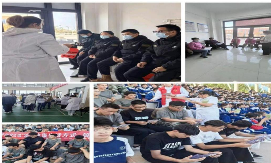
图 6-4 以“医”护“育”

职校持续构建“预防为主、防控结合”的健康安全工作体系，以多元宣传、精准防控和全面筛查为抓手，全力守护师生健康。在宣传教育方面，创新运用校园广播、专题讲座、电子大屏等载体，系统普及健康知识；全年开展培训 17 场次，包括疾控专家开展的传染病预防及无烟日主题培训 3 次、线上师生宣传 10 次，以及健康生活方式、蚊媒传染、心肺复苏与急救等专项培训 4 次，实现健康教育全覆盖。在传染病防控工作中坚持预防为先的原则，针对传染病易发季节，每日 2 次重点区域消杀，面向教官、门岗、保洁及商铺人员开展消毒液配比培训 20 次，落实流感每日监测与缺课上报制度，确保风险早发现、早处置。在健康保障方面，完成 810 名新生结核筛查、796 名新生常规体检及 264 名学生常见病筛查，推动麻腮风疫苗接种 96 人、HPV 疫苗接种 110 人，并新增 3 台 AED 设备，切实筑牢校园免疫屏障与应急救护能力，为师生营造安全、安心的学习生活环境。