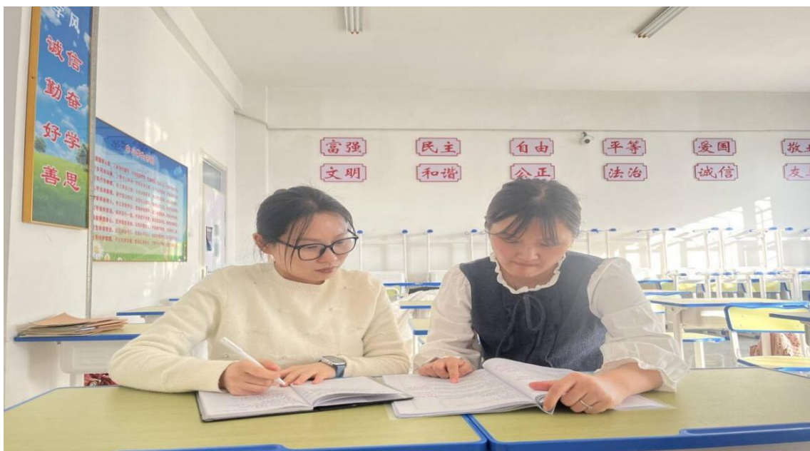
图 6-6 共同探讨教学设计

组织了 36 位指导教师与 60 位青年教师结成了师徒对子，制定落实了职校“青蓝工程”实施方案，落实了“师徒对子”手册的撰写、检查工作，促进青年教师健康成长。