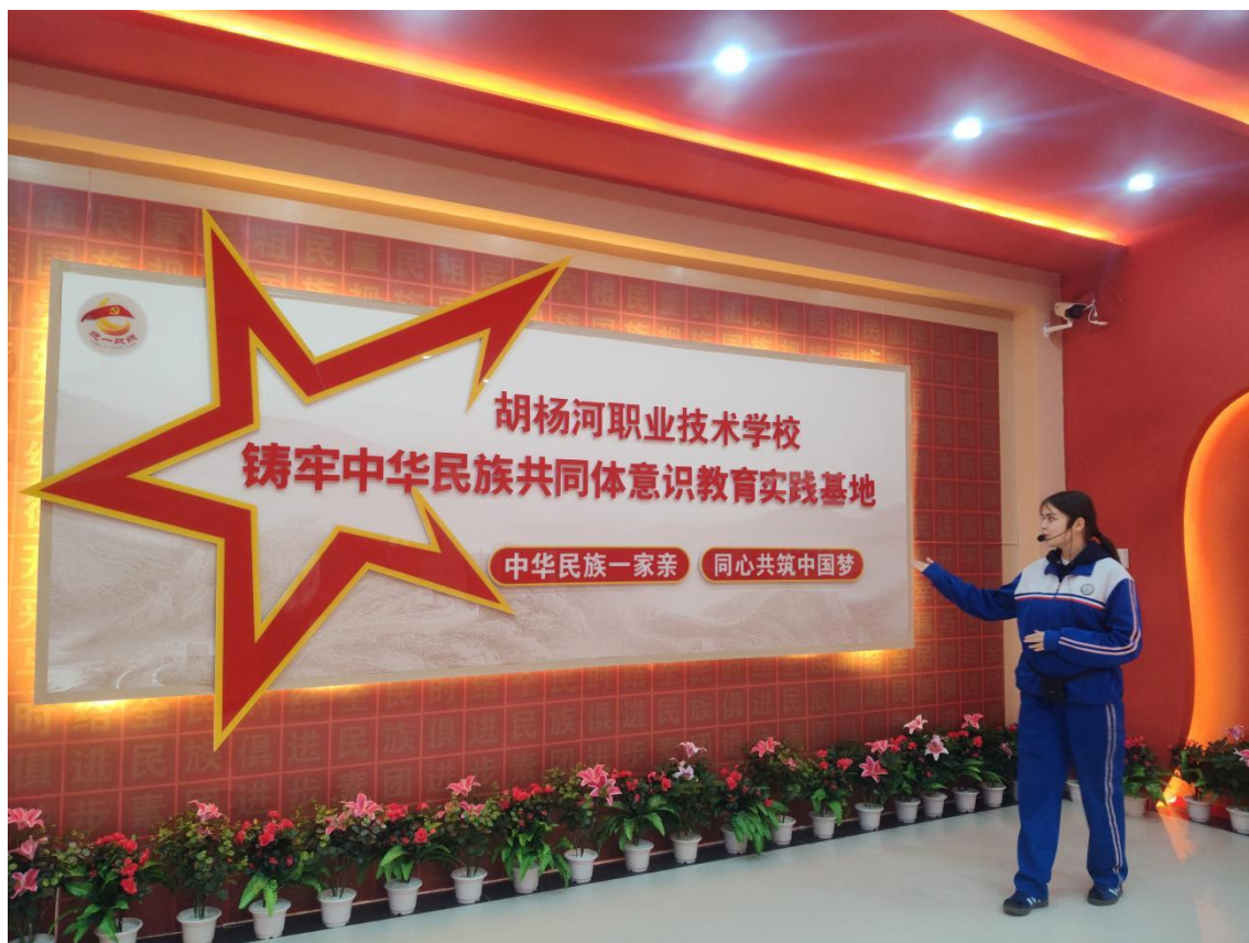
图 2-2 学生讲解铸牢中华民族共同体意识教育实践基地

对互动。教师与学生结对，协助学生掌握专业学科知识，解决其在生活和学习中面临的难题，定期开展谈心谈话，并与家长沟通学生在校表现，深化家校共育。进一步强化铸牢中华民族共同体意识教育实践基地的示范作用，选拔学生讲解基地核心内容，使学生从聆听者蜕变为讲述者，让思政教育突破传统说教框架，润物无声地在学生心中播撒红色种子。基地接待了师市、兵团及自治区领导的调研，推动各民族学生深度交融，营造“人人讲团结、事事讲团结”的和谐氛围。职校还加强兵地资源共享，以有形、有感、有效的方式铸牢中华民族共同体意识。