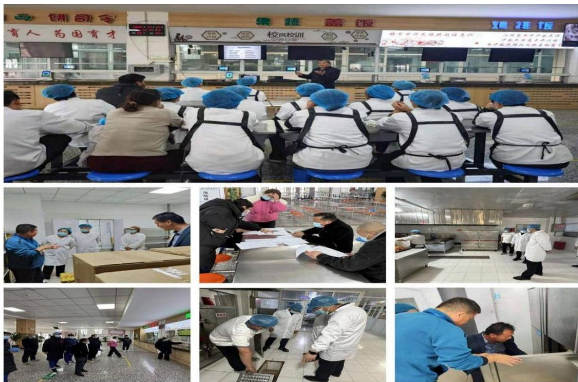
图 6-2 食安无小事：校食堂的培训、巡检与安全守护现场

现并整改问题 90 项。针对数据分析识别出的“蔬菜粗捡切配”高频风险点，我们组织了两轮专项培训，从操作规范、卫生标准和责任意识三个维度进行系统强化，最终从根源上解决了此类重复性问题，实现了从治标到治本的管理跨越。