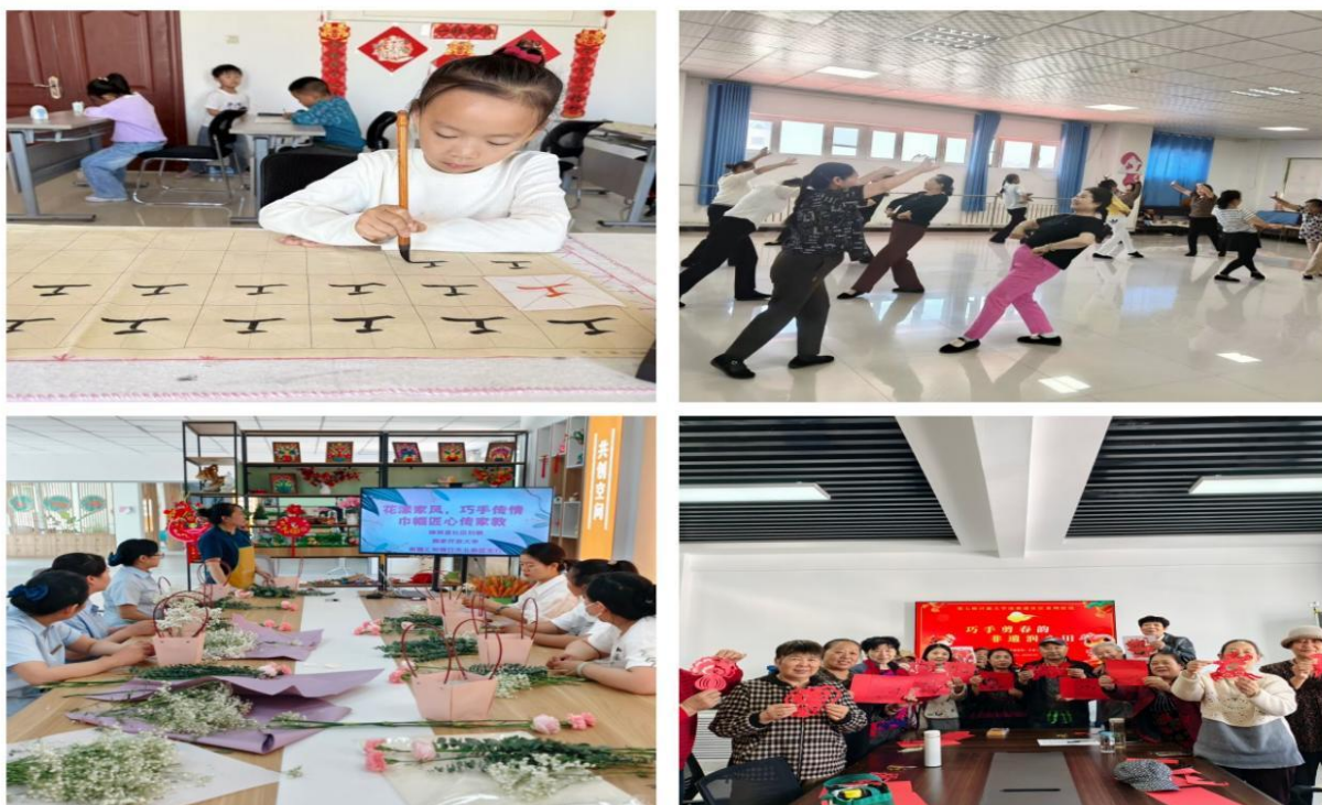
图 3-2 社区教育活动剪影

2025 年 10 月下旬，由兵团开放大学牵头，第七师开放大学承办的社区培训系列活动更是获得了社会层面的广泛好评，受到了第七师融媒体中心报道和宣传，登上了《学习强国》