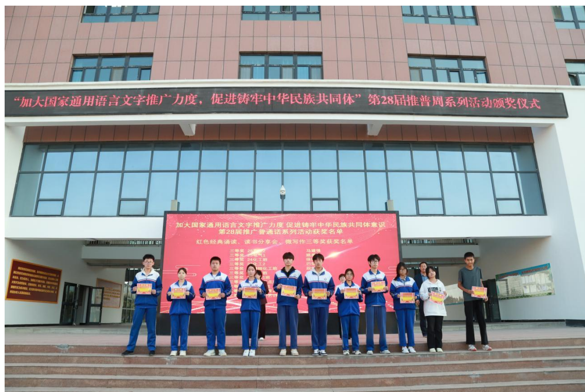
图 4-1 推普周颁奖