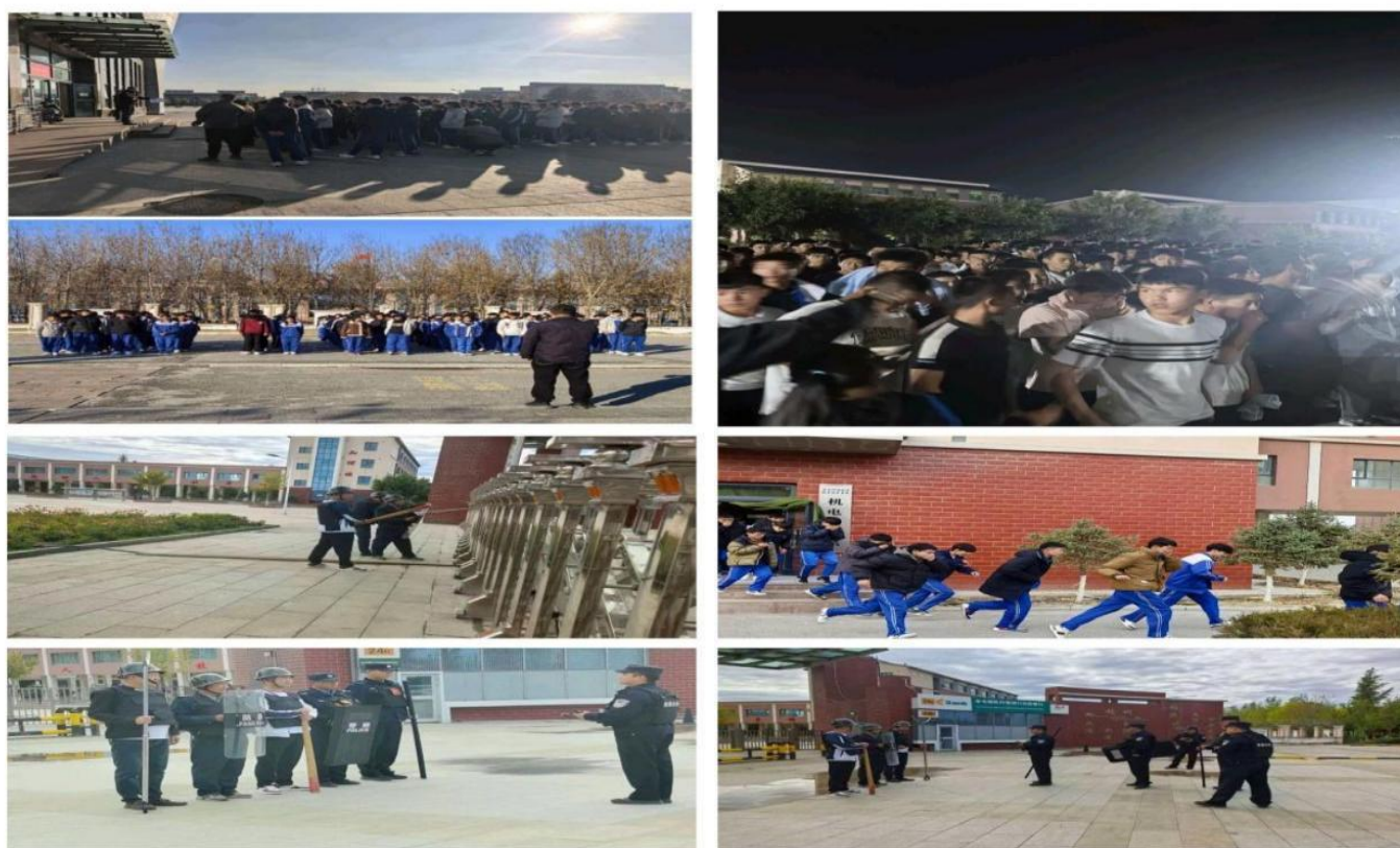
图 6-3 安全“必修课”：从值守到演练，筑牢校园平安防线

提升，累计组织消防疏散演练、抗震避险演练 12 次、健康教育相关培训 17 次，参与师生覆盖率 100%，师生应急响应速度平均提升 15%。为提高职校整体安全防护技术水平，根据去年申报项目，兵团今年拨付 150 万元资金，用于强化校园安防保障，包括重点部位增加监控摄像头，完善校园周界报警系统，为宿舍楼安装烟感报警器等升级改造工作；专职安保人员 8 名，每周开展 30 分钟防暴器械实操演练；新修订的《校园车辆人员管理办法》落地后，严格落实入校流程管控，全方位筑牢校园安全防线。