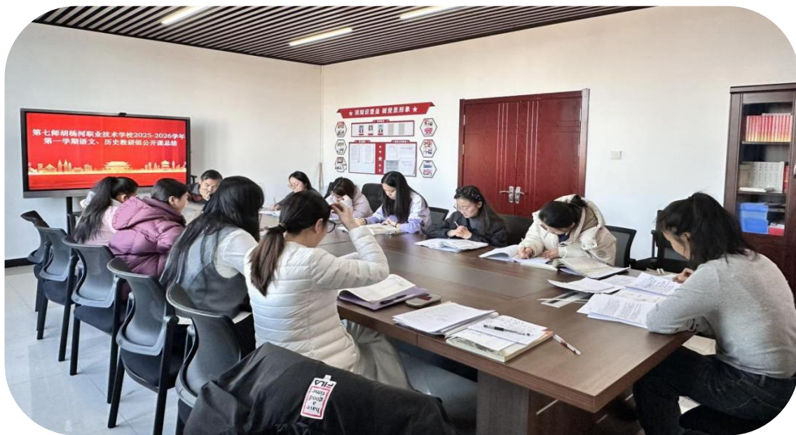
图 6-7 教研组教师举行公开课评课研讨会