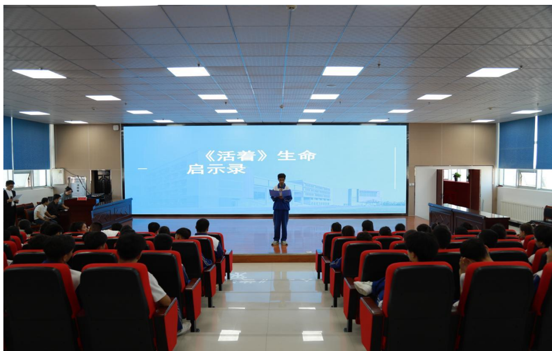
图 4-2 读书节学生朗诵比赛