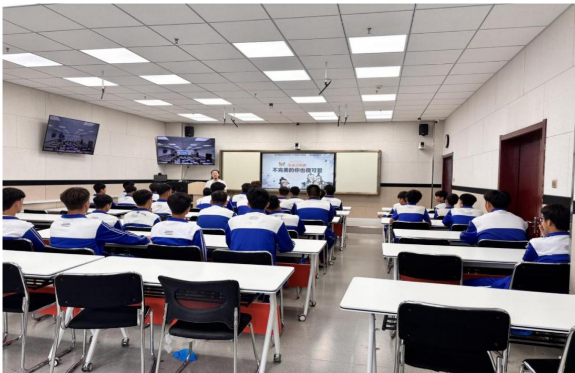
图 2-3 开展学生心理健康教育

长”“情绪管理”等主题团体辅导；举办心理健康宣传教育月活动，通过海报、讲座和短视频等形式普及心理健康知识。2025 年，累计实施个体辅导 778 人次和团体辅导 13 场，学生心理健康水平显著提升，校园心理危机事件实现零发生。