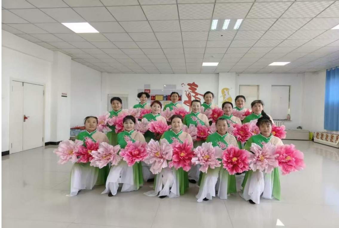
图 3-1 社区教育典型案例刊登