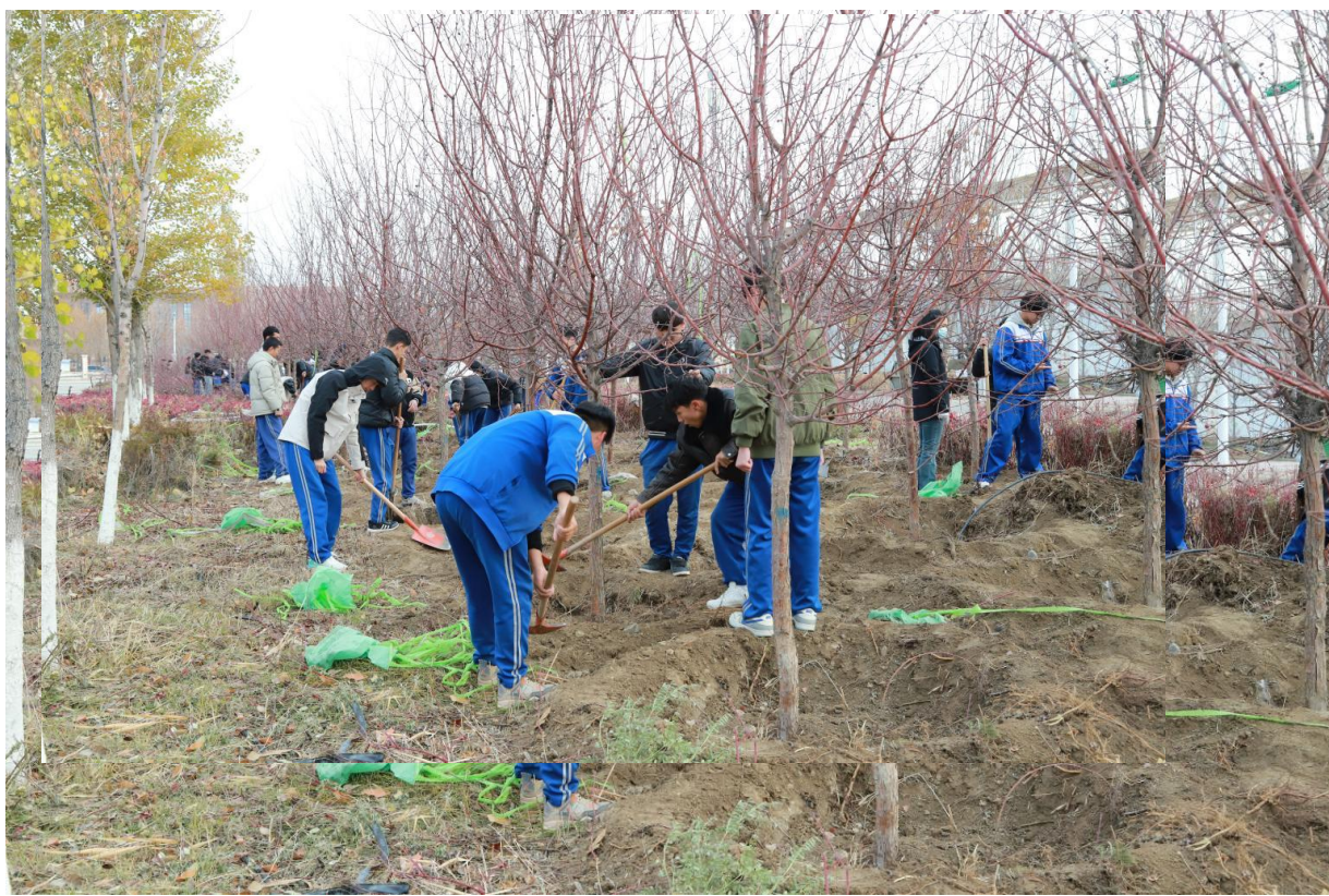
图 6-1 劳育润心 服务暖心

2025 年，职校以“守护师生安全、打造宜居宜学生态”为核心目标，聚焦校园安全与环境提质，精准推进设施升级与运维优化：为筑牢全维度安全屏障，投入 3.1 万元更新消防设备，强化校园安全保障；为提升师生使用舒适度，精准开展多栋楼宇漏水、门窗、墙面及水电暖管道修缮，更换教学楼灯管、修复厕所设施，全面保障教学与生活功能高效运转；为营造“推窗见绿、移步赏景”的生态美育空间，新增鸢尾等花卉 5.1 万株、植树 892 棵，让校园颜值与人文底蕴双向提升；为厚植暖心服务底色，食堂添置专业设备优化就餐保障，新增 20 个垃圾桶、增设室外投光灯、铺设防滑毯，从细节处改善师生生活体验，让校园更具温度与归属感。