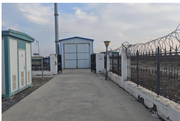
危废贮存库外南侧