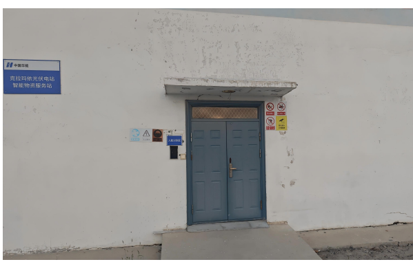
克拉玛依光伏电站管理区