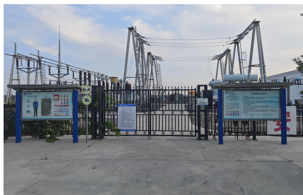
克拉玛依光伏电站管理区