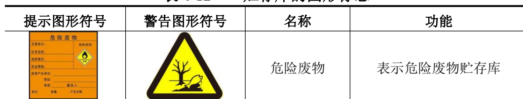
表 4-12 贮存库的图形标志

本项目贮存库应根据《环境保护图形标志 固体废物贮存（处置）场》（GB15562.2-1995）修改单中有关规定，设置国家统一制作的环境保护图形标志牌。危险废物贮存库图形标志见下表：